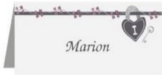
Tischkarte "Key to Heart"